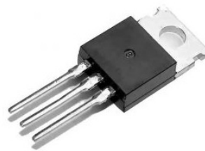
Рис.3. Симистор ВТА12-600BRG