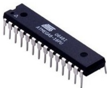
Рис.2. AVR микроконтроллер ATmega8