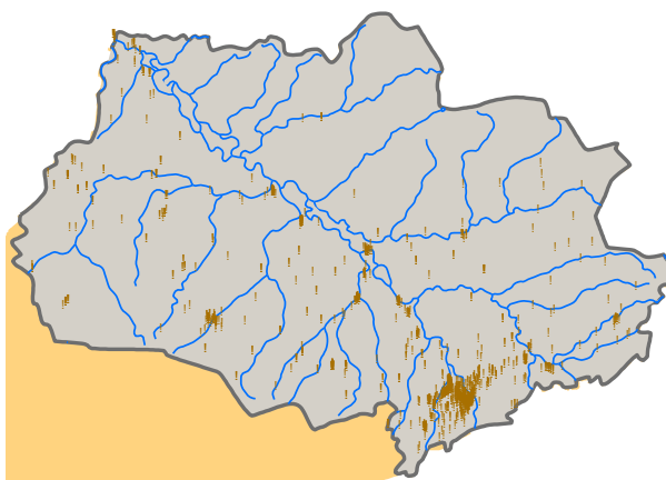
Рис. 1. Схема распространения палеогенового водоносного комплекса и пунктов опробования подземных вод

Для выявления закономерностей пространственного распределения минерализации по результатам выборки пунктов наблюдения выполнен статистический анализ химического состава подземных вод.