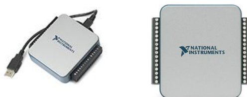
Рис. 2. Мультифункциональное устройство сбора информации NI USB 6002

В данной системе в качестве блока сбора и обработки сигнала предлагается использовать мультифункциональное устройство сбора информации NI USB 6002. Рисунок приведен ниже.