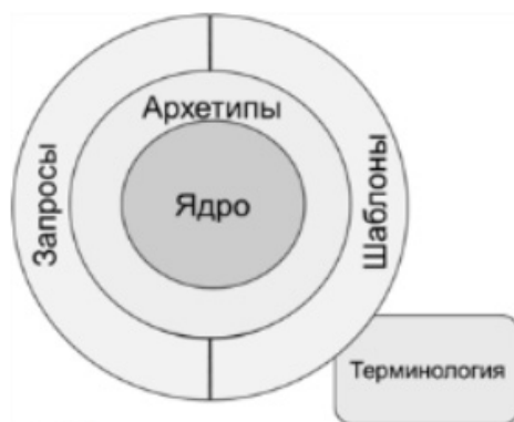
Рис. 1. Общая схема описания данных стандарта openEHR

В openEHR , все медицинские данные о пациенте хранятся в течение всей его жизни, данные не зависят от того какая организация их создала, вся размещенная информация ориентирована на человека. Основной целью openEHR является не обмен данных между EHR -системами, а стандарт сообщений. Ключевое новшество в openEHR структуре – оставить всю спецификацию клинической информации вне информационной модели, но наиболее важно, обеспечено мощное средство выражения, как клинических данных и медицинских данных пациента, что позволяет записать их таким образом, что информация может пониматься и обрабатываться требованием. Основой этого стандарта является создание клинических информационных моделей на основе формирования архетипов и шаблонов. Общая схема представлена на рис. 1. Ядром системы является система базовых типов и способ построения ссылок. Это статическая неизменяемая часть [2].