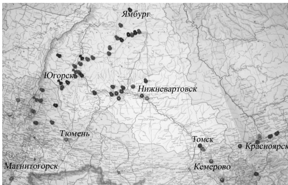
Рис. 1. Карта внедрений ЛИС/ЛИУС «Химик-аналитик» в Урало-Сибирском регионе

Одна из целей внедрения ЛИУС (кроме автоматизации информационного пространства лаборатории и функций обработки данных) – управление лабораторией. Качественное управление должно основываться на оперативных и достоверных данных как текущей ситуации, так и данных фактического прошлого и планируемого будущего лаборатории и ее внешней среды (обслуживаемого производства). Информационная система должна отражать динамику развития лаборатории во времени. Исследова-